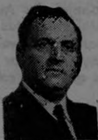
Dr. Rafael A. Calderón G.